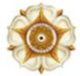
Universitas Gadjah Mada